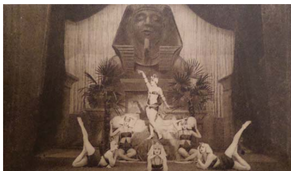
3. ábra. Miss Arizona Miniatur Revue – Reine de Saba