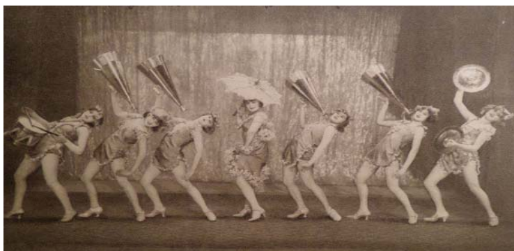
1–2. ábra. Miss Arizona Miniatur Revue – My Baby