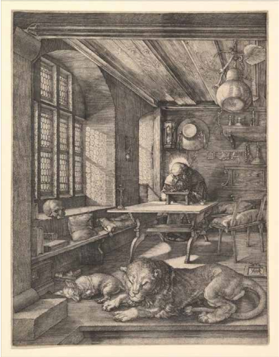
4. ábra. Albrecht Dürer: Szent Jeromos a Studiolóban (rézmetszet, papír, 24,6 x 18,9 cm, 1514)